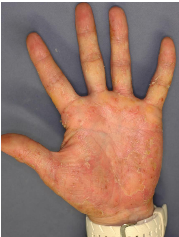
Photo taken at the new hospital. One and half months after onset of PPP. Pustule observed on fingers now.